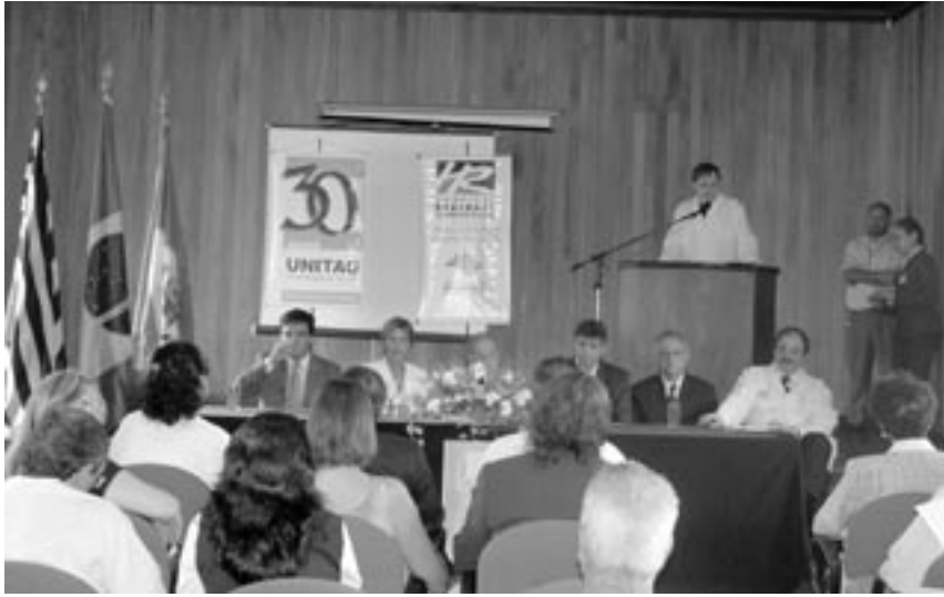
Os membros do Conselho Gestor - formado por representantes do Governo do Estado de São Paulo, da Universidade de Taubaté, da Prefeitura Municipal de Taubaté e das prefeituras dos municípios que integram o Vale do Paraíba - foram empossados em cerimônia oficial no auditório do Campus do Bom Conselho

O dia primeiro de dezembro representou um marco na história da saúde de Taubaté e região. Os trabalhos inerentes à integração entre os dois maiores hospitais do município, o Hospital Universitário de Taubaté (HUT) e o Hospital Regional do Vale do Paraíba, tiveram início com a posse do Conselho Gestor - grupo responsável pela supervisão e acompanhamento das atividades previstas no termo de cooperação técnica, firmado em maio deste ano.